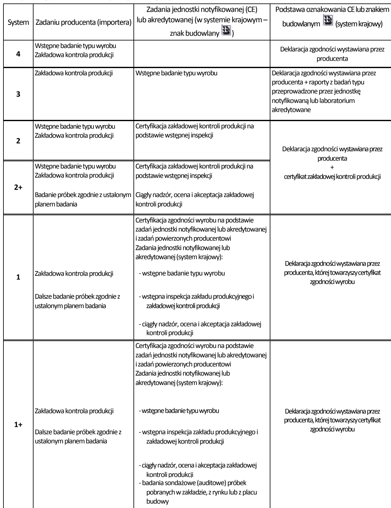
Tablica 1 Zestawienie zadań w ramach systemów oceny zgodności wyrobów budowlanych wykonywanych zgodnie z systemami oceny zgodności odpowiednio przez producenta lub jednostkę notyfikowaną (w procedurze oznakowania CE) lub akredytowaną (znakiem budowlanym - system krajowy).